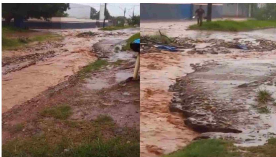
Enxurrada forte impedia pedestres de atravessarem