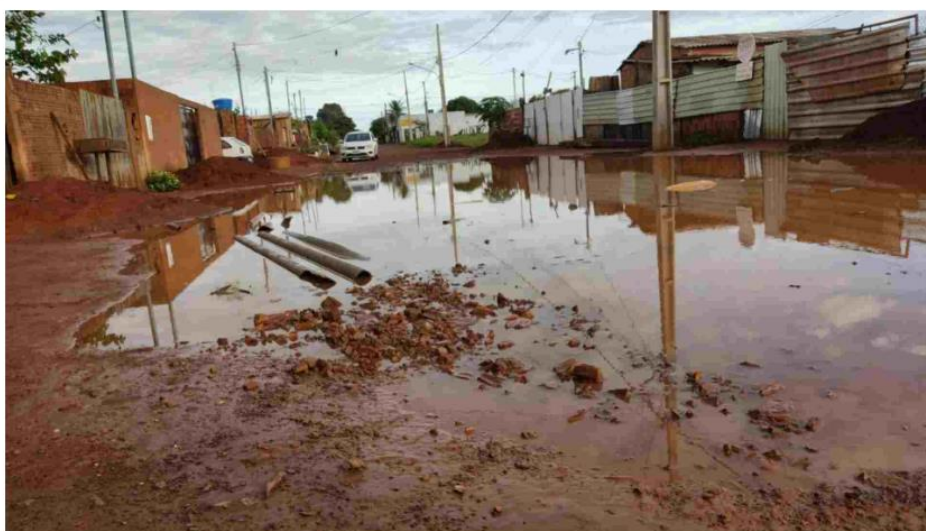
Rua Astúrio Luis Braga permanece parcialmente alagada