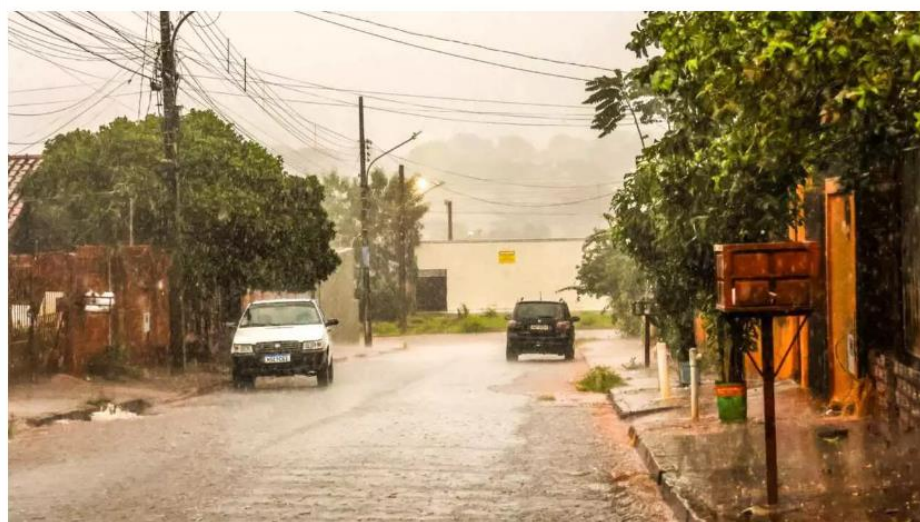
Chove forte em Campo Grande

A segunda-feira (15) começou com clima ameno em Campo Grande, mas em poucas horas o dia virou noite. Chove forte na Capital e a temperatura caiu para 24°C, a previsão é de temporais a qualquer momento e muita chuva até terça-feira (16).