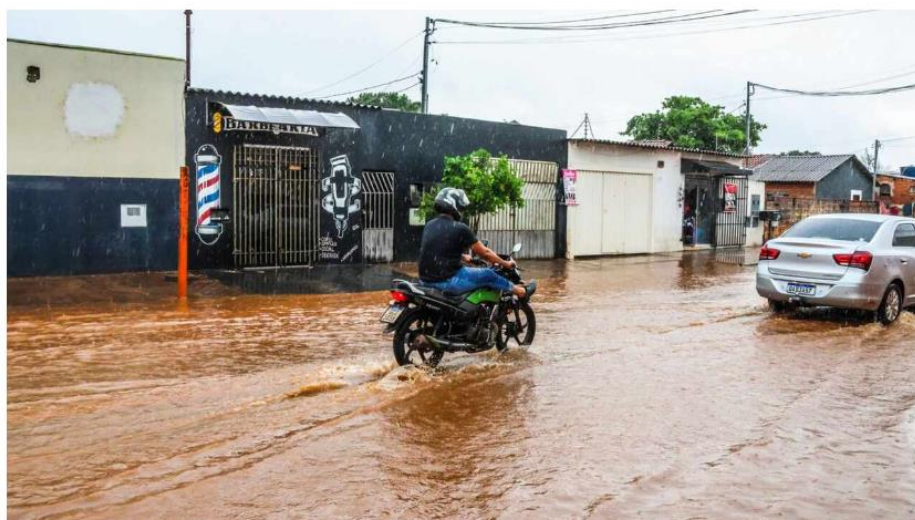
Alagamento no Los Angeles