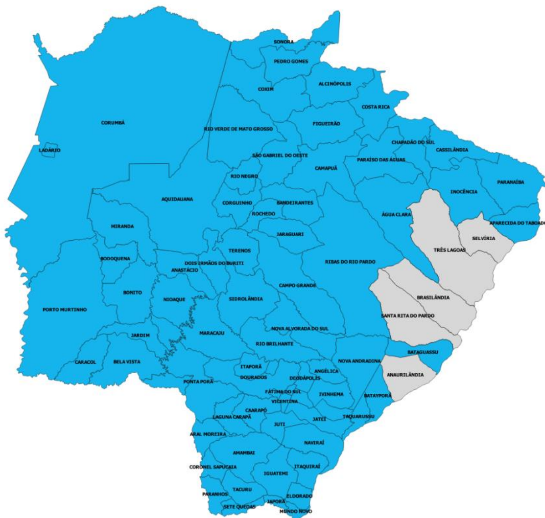
Figura 2 - Municípios com as áreas afetadas em azul.

Os municípios afetados pelo evento climático que tiveram expurgo por situação de emergência, encontram-se na Tabela 1.