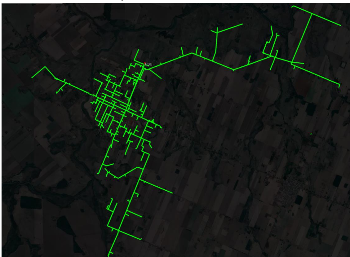
Figura 3 - Alimentadores afetados.

E na Figura 3, é possível ver a configuração física desses alimentadores.