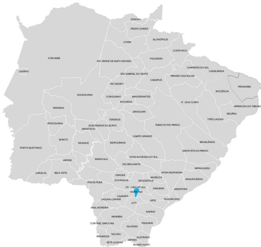
Figura 2 - Municípios com as áreas afetadas em azul.

Os municípios afetados pelo evento climático, encontram-se na Tabela 1.