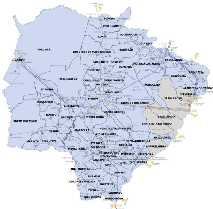
Figura 2 - Diagrama unifilar da subtransmissão com as áreas afetadas em azul

A figura a seguir ilustra as áreas afetadas por situação de emergência para o mês de dezembro.