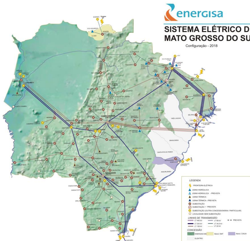
Figura 1 - Mapa geoeletrico da concessão da EMS

A figura 1 a seguir ilustra o mapa geoeletrico da concessão da EMS.