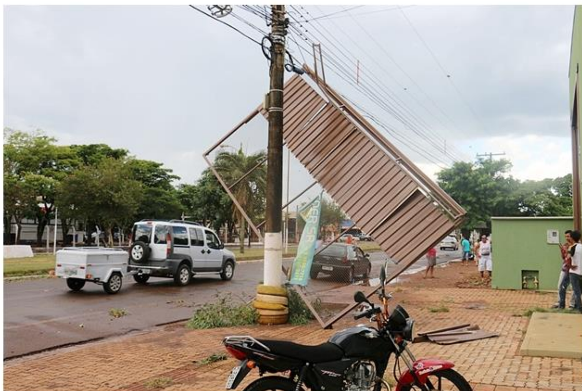
Portão de elevação foi arrancado com a força do vento.

Em poucos minutos, um temporal atingiu Sidrolândia, município a 74 km de distância de Campo Grande, e provocou estragos na cidade durante a tarde desta sexta-feira (21). Diversos troncos e árvores foram arrancadas devido a potência do vento e até um portão de elevação foi arremessado em direção a fiação telefônica.