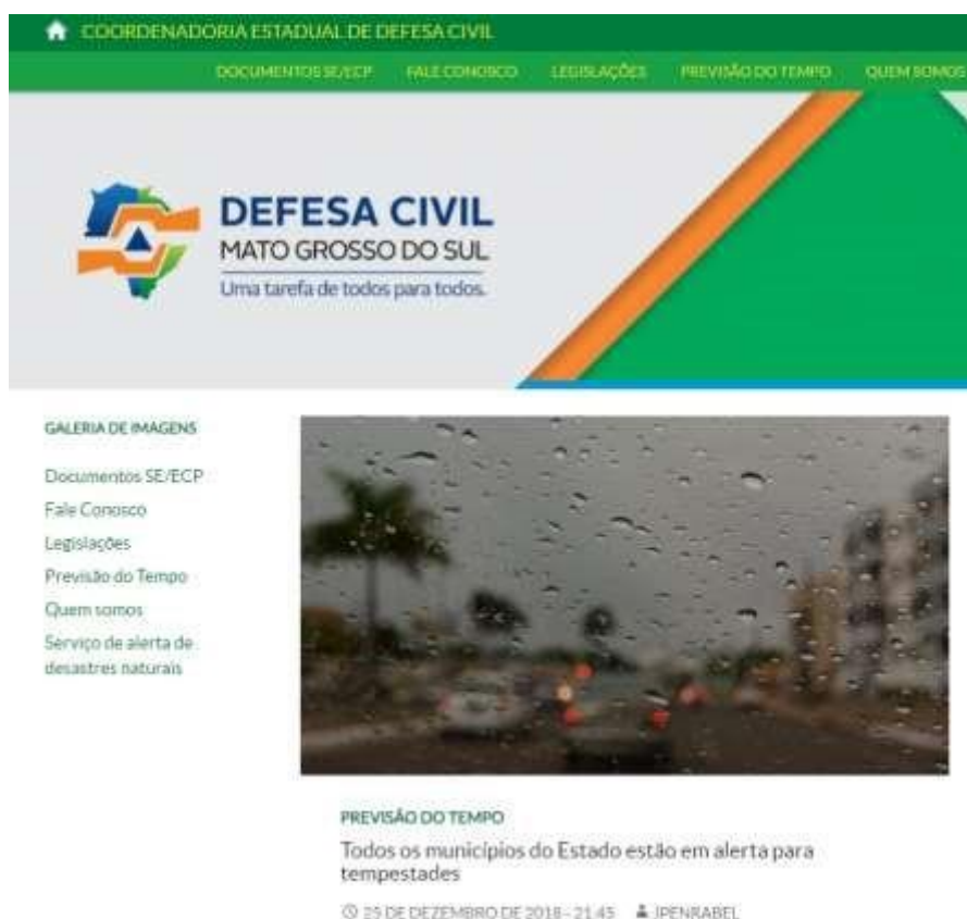
Figura 2 – Evidências de tempestades no dia 25/12 no estado do Mato Grosso do Sul.

Foram encontradas evidências na mídia de tempestades em diferentes locais do estado, conforme mostrado na Figura 2.