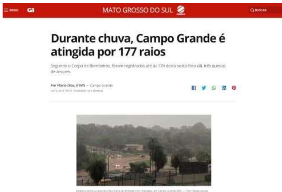
Figura 4 – Evidências de tempestades no período no estado do Mato Grosso do Sul [4, 5].