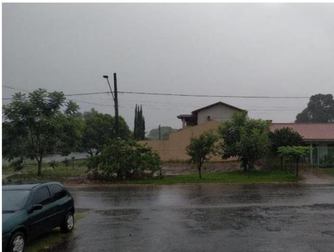
Céu "desabou" hoje em Amambai e tempo nublado é promessa de mais chuva.