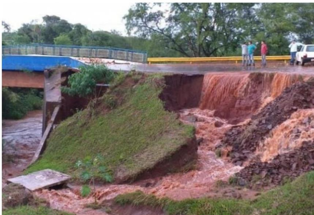
Aterro da ponte sobre o rio Panduí foi levado com a força da enxurrada.

Temporal com 80 milímetros de chuva causou alagamentos em ruas, residência e levou a interdição de uma ponte sobre o rio Panduí, nesta quinta-feira (19) em Amambaí, município a 360 quilômetros de Campo Grande. O acesso a ponte é um prolongamento da rodovia "GuairaPorã", que interliga Ponta Porã a BR-163 na região de Eldorado.