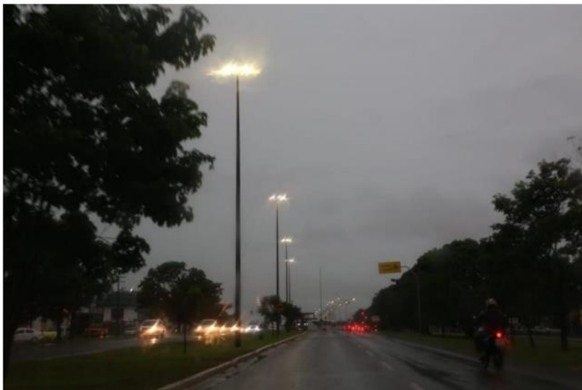
Céu escuro no meio da tarde na Avenida Gury Marques, em Campo Grande

O período chuvoso e chegada de uma frente fria fizeram da tarde o início de noite desta segunda-feira (16) em Campo Grande. Os termômetros caíram mais de 11°C em 2 horas e os ventos atingiram quase 60 km por hora.