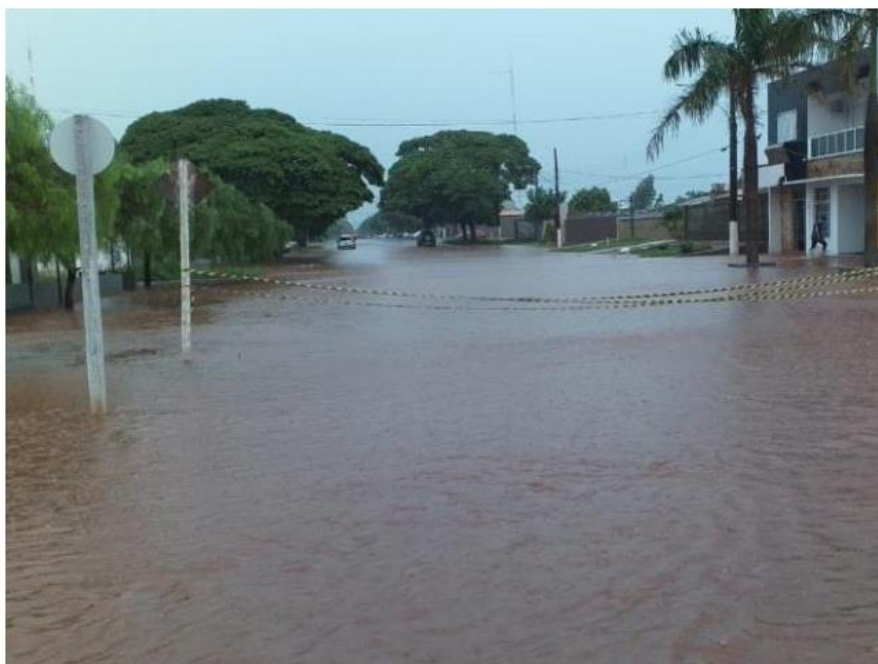
Rua de Amambai se transformou em um rio durante o temporal.

Segundo a Defesa Civil, a prefeitura com o apoio da Polícia Militar, vai manter sistema "pare e siga" no local para controlar o tráfego. Ainda de acordo com a Defesa Civil na manhã dessa sexta-feira (20), técnicos farão uma nova vistoria na ponte para averiguar as condições e decidir se mantém o tráfego somente para veículos leves ou se libera para veículos de carga.