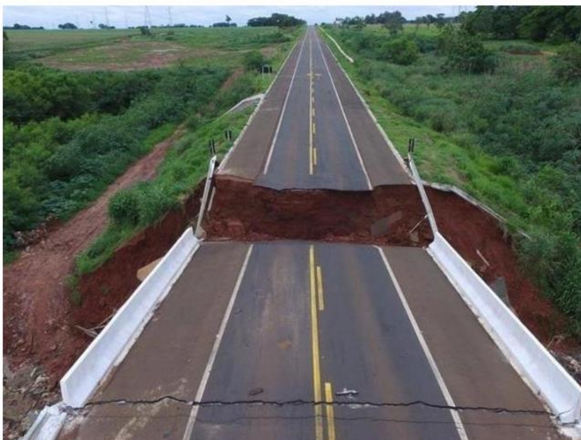
Ponte sobre o córrego Umbaracá caiu ontem em Nova Andradina.

Em 2015, ponte caiu e prefeitura recebeu recursos da União para erguer uma nova, mais alta e larga