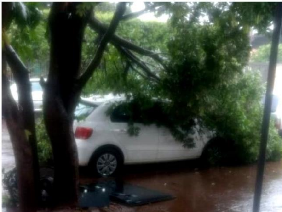
Galhos de árvores caíram sobre veículo na Rua Anchieta

A chuva prossegue, por vezes forte, nesta segunda-feira (16) no interior de Mato Grosso do Sul. No município de Itaquiraí, distantes 410 km de Campo Grande, foram registrados 126,2 milímetros de água somente hoje, de acordo com o meteorologista Natalio Abrão.