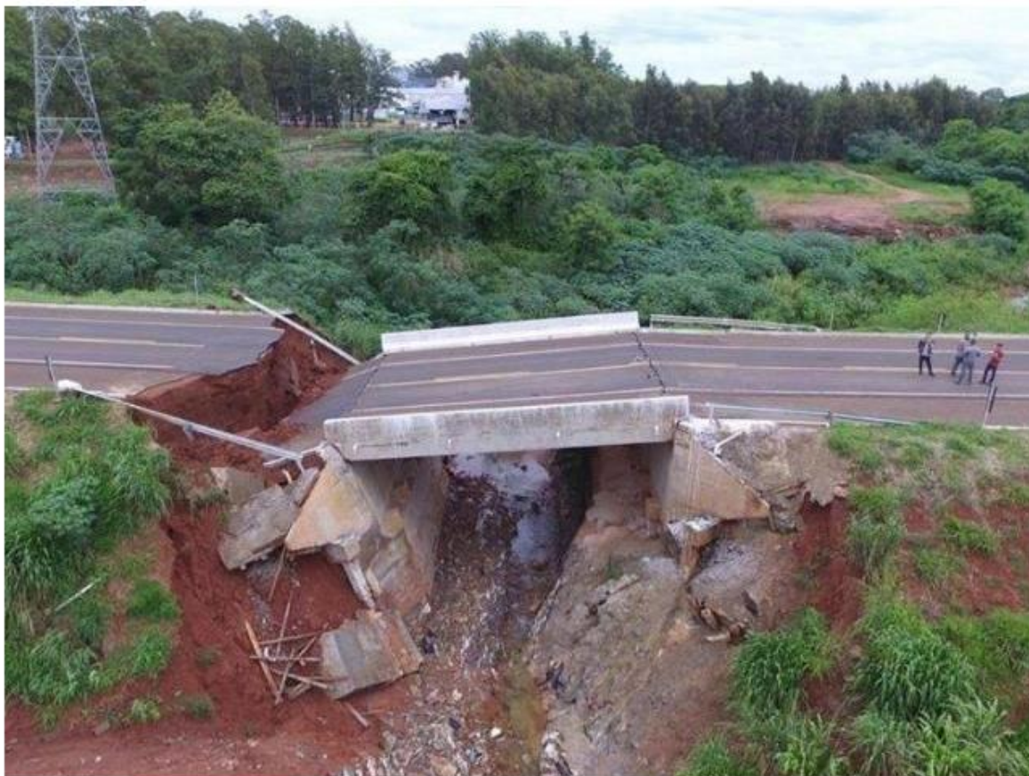
Ponte foi entregue em 2018 e obra custou R$ 1 milhão.

Conforme o coordenador, a chuva acumulada em 17 dias de dezembro totaliza 400 milímetros, enquanto o esperado era 250 milímetros em todo o mês. A ponte sobre o córrego Umbaracá fica no contorno viário Fernando Vasconcelos, que havia retirado o trânsito pesado do perímetro urbano, fazendo a ligação com as rodovias MS-134 (saída para Batayporã) e MS-473 (saída para Taquarussu).