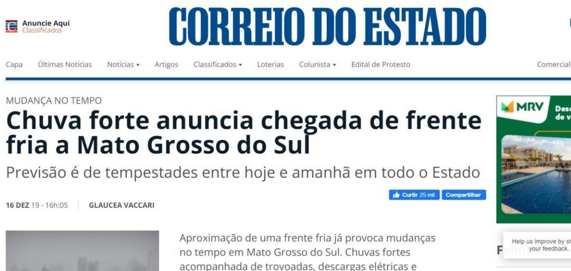
Figura 4 – Evidências de tempestades no dia 16/12 no estado do Mato Grosso do Sul.

Foram encontradas evidências na mídia de tempestades em diferentes locais do estado, conforme mostrado na Figura 4.