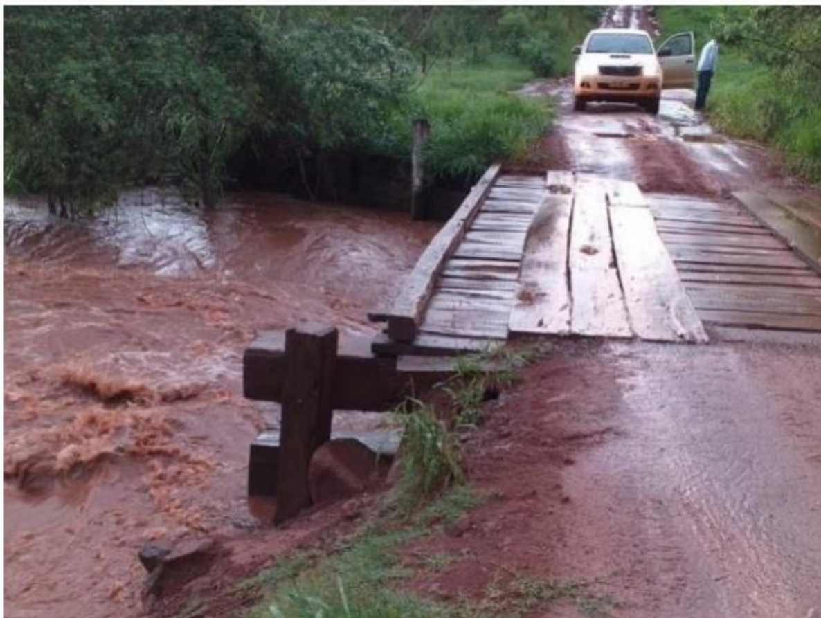
Ponte de madeira em estrada vicinal da cidade.