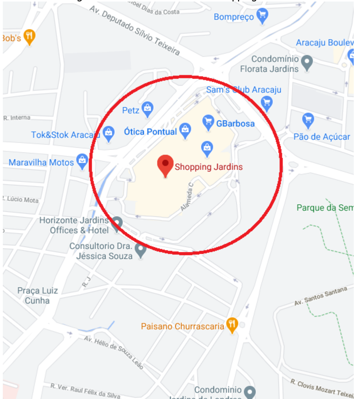
Região do incêndio - Condomínio Shopping Jardins