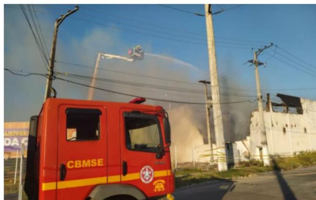
Bombeiros atuam no combate ao incêndio