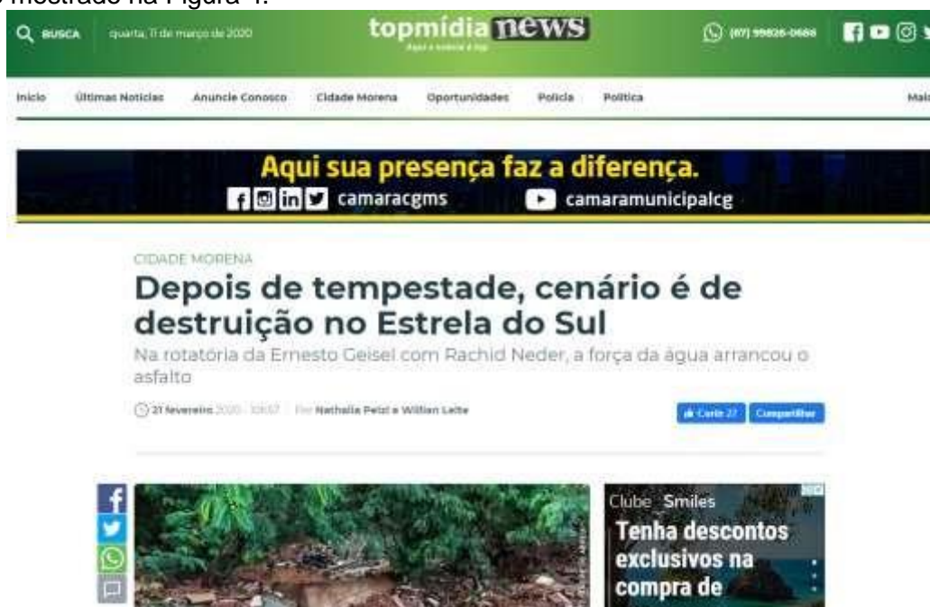
Figura 4 – Evidências de tempestades no estado do Mato Grosso do Sul.

Foram encontradas evidências na mídia de tempestades em diferentes locais do estado, conforme mostrado na Figura 4.